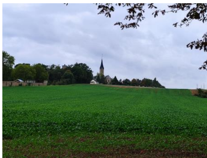
L'église de La Boissière-Ecole