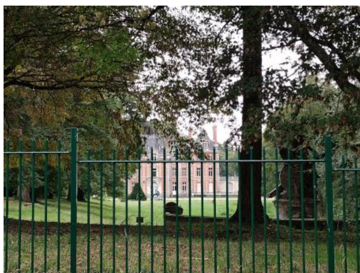
Le château de La Boissière-Ecole