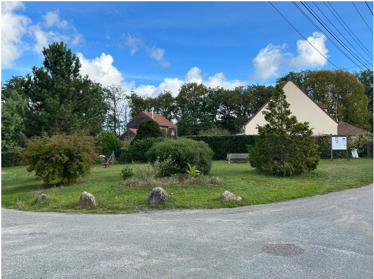
La place du Val