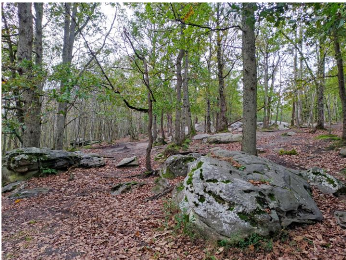
Les rochers de grès