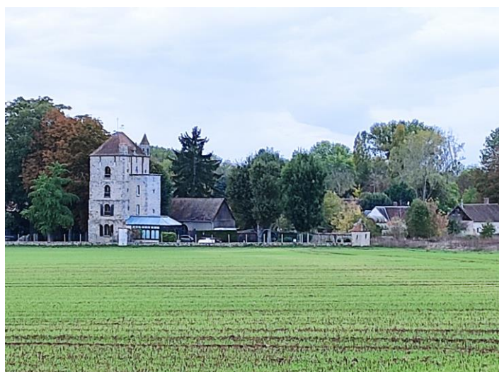
La tour de Saint Lucien